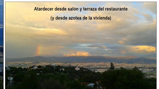
Atardecer desde salón y terraza del restaurante (y desde azotea de la vivienda)